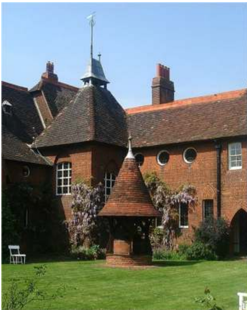
Inspirace řemeslnou dokonalostí gotiky

Znechucení přeplácaností historizujících stylů