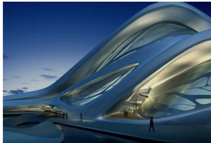
Futuristická amébovitá architektura v duchu Kaplického knihovny