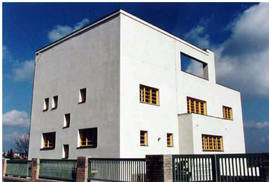
Müllerova vila od Adolfa Loose

Druhý směr má organické tvary - futurismus