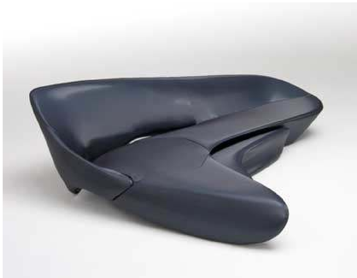
Zaha Hadid - pohovka